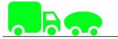
LES FLOTTES DE VEHICULES DES ENTREPRISES