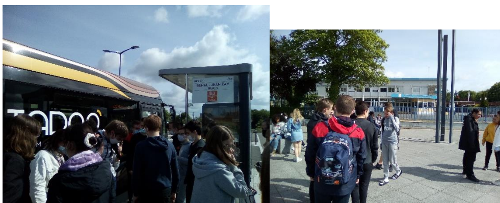
Troisième étape : le lycée Béhal, puis prendre la bulle n°3 vers Bibliothèque pour une correspondance.