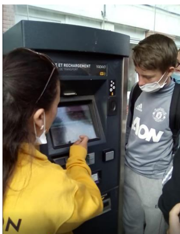
Explications du fonctionnement d'une borne de titre de transport.