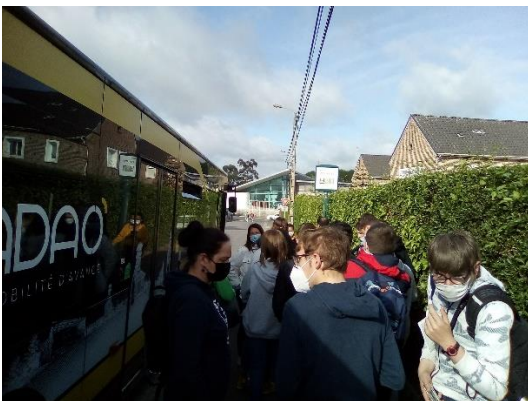
Première étape : Descartes pour le lycée Henri Darras. Ensuite on prendra la bulle n°1 pour le lycée Condorcet.