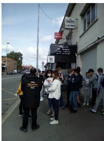
Correspondance à Bibliothèque pour attendre la ligne 19 vers le collège.