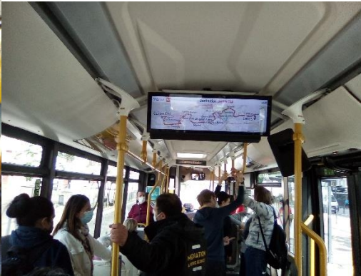
Dans le bus, on s'assoie et on écoute les conseils des médiateurs et on regarde le trajet sur l'écran.