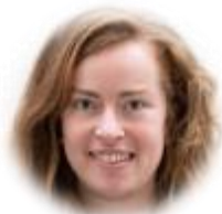
Alanne Maison Référente Stationnement