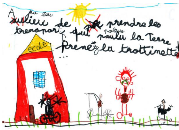
Affiche créé par les élèves de l'école d'Hétomesnil