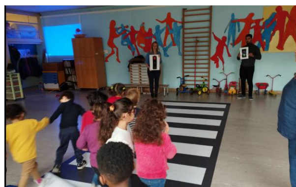
Animations de l'Agglomération Creil Sud-Oise dans plusieurs écoles du territoire.