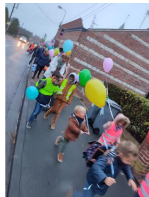
Pédibus de l'école Soetard – Sailly-lez-Lannoy