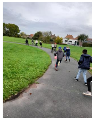
Défilé écomobile – Ecole Les Boutons d'Or – Ledrighen