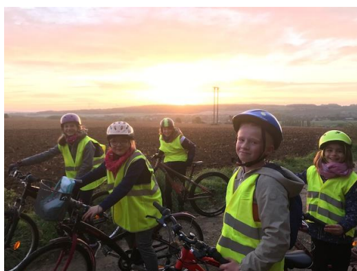
Vélobus entre les villages de Bours et Pressy