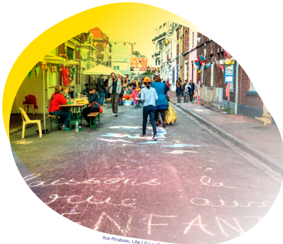
Rue Mirabeau, Lille