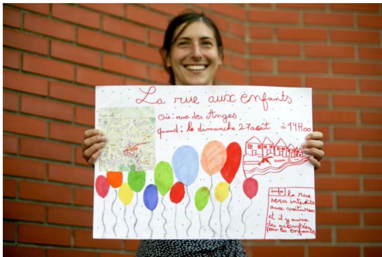
L'affiche de l'événement de la rue aux enfants a été dessinée par Mohammad, un amandinois âgé de 11 ans