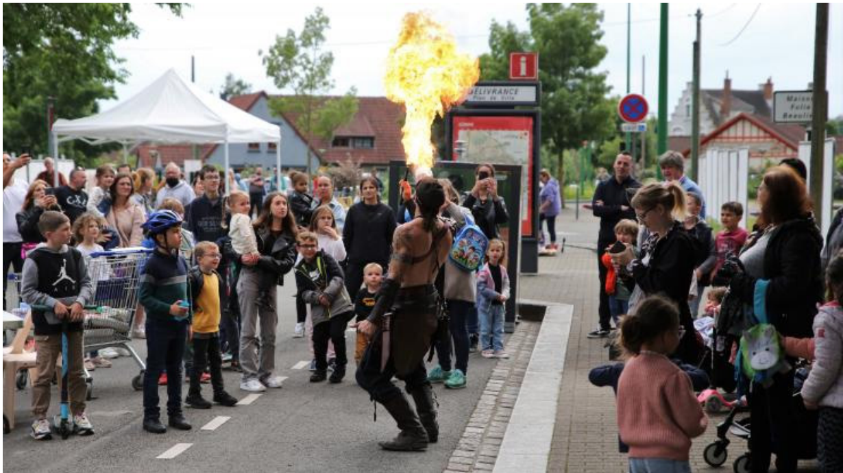
Pour l'occasion, les parents de l'APE avaient même prévu un spectacle